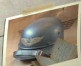
Journal de garnison d'un soldat allemand

la petite fille qui ne voulait pas grandir