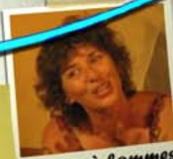
femme à hommes